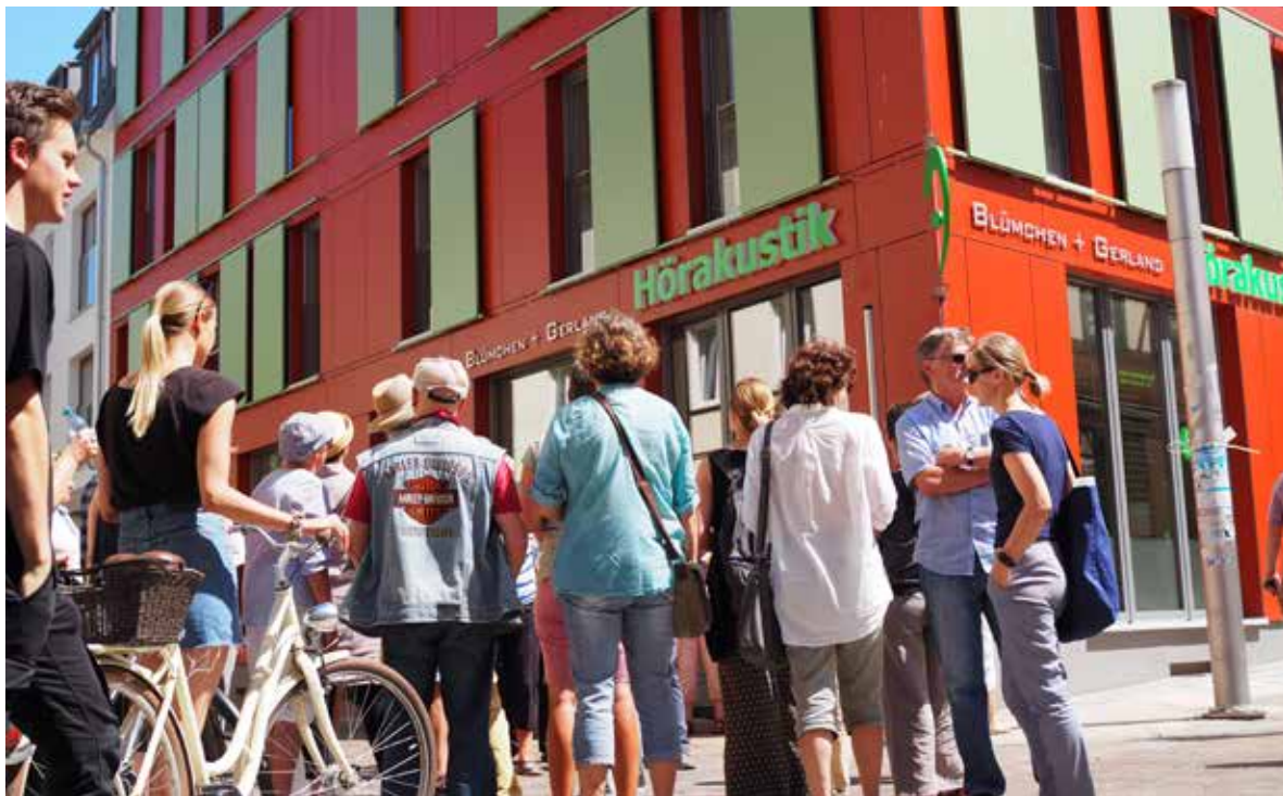
Stadtführung „Mut zur Lücke“ der Kammergruppe Schwerin zeigte 2019 realisierte Wohn- und Gewerbebauten der Landesinitiative „Neues Wohnen in der Innenstadt“, Architektur „Schlossquartier“ von JSL Architekten